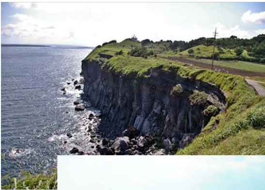
「チャングムの誓い」ロケ地