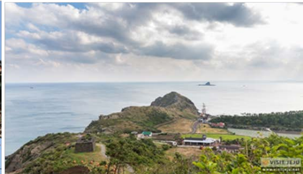
山房窟寺(サンバングルサ)