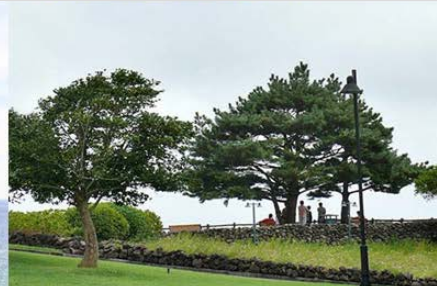
Swiri Bench シュリの丘