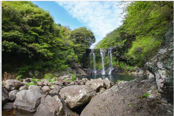
天帝淵瀑布(チョンジェヨンポツポ)